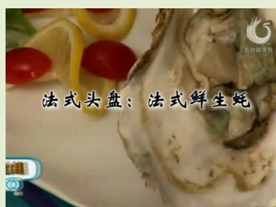
法式头盘：法式鲜生蚝