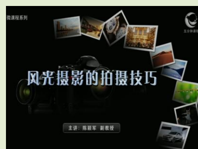
风光摄影的拍摄技巧