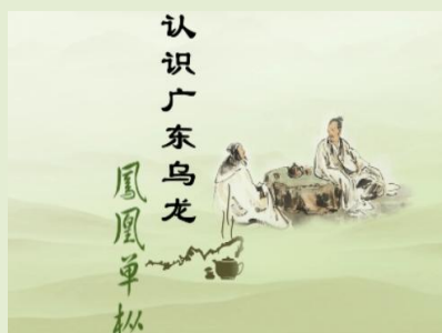
认识广东乌龙——凤凰单枞