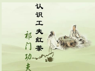
认识工夫红茶——祁门功夫